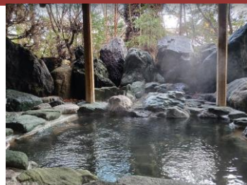
自家源泉・露天風呂