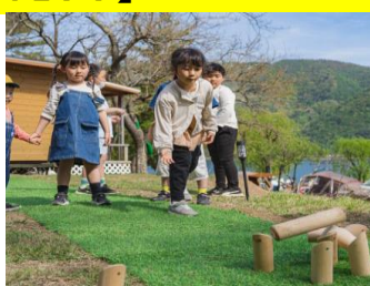
モルックであそぼう！