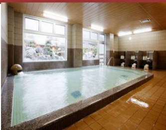
自家天然温泉・大浴場