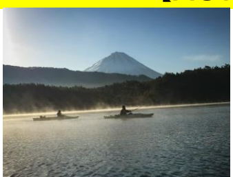
カヤックレンタル